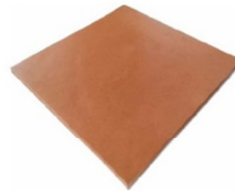
Ceramice Liso Rosso 33 art. 2109