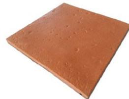
Ceramice Terra Rosso 40 art. 1809